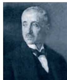
Carl Melchior (1871–1933)