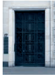
M.M. Warburg & CO in Köln