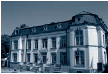
Das Bankgebäude in Luxemburg