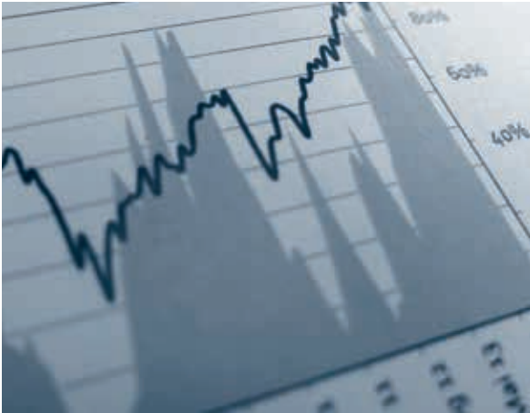
Neueste Trends ...

Bereich beraten und begleiten wir unsere Kunden bei allen Themen mit Bezug zum Kapitalmarkt . Die Strukturierung und Platzierung von Neuemissionen (IPOS), die Platzierung von Kapitalerhöhungen und Secondary Placements sowie Beratungsleistungen bei Übernahmeangeboten und Delistings gehören zu unserem Portfolio. Die Abwicklung von Mitarbeiterbeteiligungsprogrammen, die Durchführung von Aktiensplits und Kapitalherabsetzungen sowie die Erstellung von Fairness Opinions sind weitere Leistungen. Zusätzlich stehen wir auch als Designated Sponsor zur Verfügung, bieten eine Vorabbeurteilung der Börsenreife und die Beratung bei der Aufnahme vorbörslicher Finanzierungen. Wir verfügen über ein umfangreiches und vielfach ausgezeichnetes Team von Analysten für volkswirtschaftliches sowie unternehmens- und branchenbezogenes Research. Unsere guten Kontakte zu einer breiten nationalen und internationalen Investorenbasis sowie unser gewachsenes und flexibles Projektteam, das sich den von uns beratenen Unternehmen langfristig verbunden fühlt, sind zum Vorteil unserer Kunden.