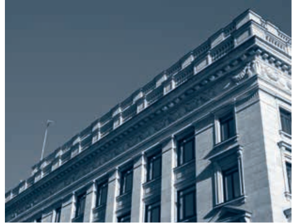
... hinter historischen Fassaden.

Fragen des Erbens und Vererbens sind für Privatkunden meist nicht alltäglich. Wir sind erfahren in der rechtzeitigen sorgfältigen Planung und Umsetzung von Vermögensübergängen. Wir gehen umfassend auf spezifische Ziele, Motive und finanzielle Fragen ein. Unter Beachtung aller rechtlichen, steuerlichen sowie