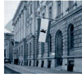
Das Bankhaus Löbbecke im Behren Palais Berlin