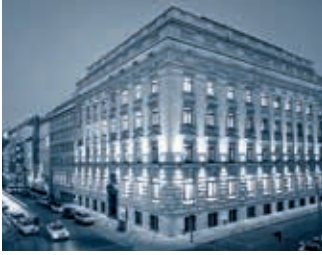
Seit 1867 Hauptsitz von M.M. Warburg & CO in Hamburg