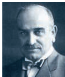
Max M. Warburg (1867–1946)