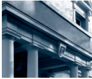
Eingang der Geschäftsstelle am Finanzplatz Frankfurt am Main