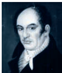
Gerson Warburg (1765–1826)