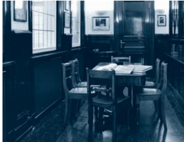
... und bewährtes Wissen.

International tätigen Unternehmen bieten wir Währungs- und Zinssicherungsinstrumente und individuelle Lösungen zur Optimierung ihres Risikoprofils. Unser institutionelles Sales Team betreut Kunden aus der ganzen Welt. Dank